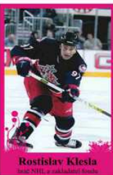
Rostislav Klesla hokej NHL a reprezentant Čechy