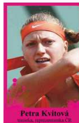
Petra Kvitová tenistka, reprezentantka ČR