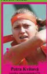
Petra Kvitová tenistka, reprezentantka ČR