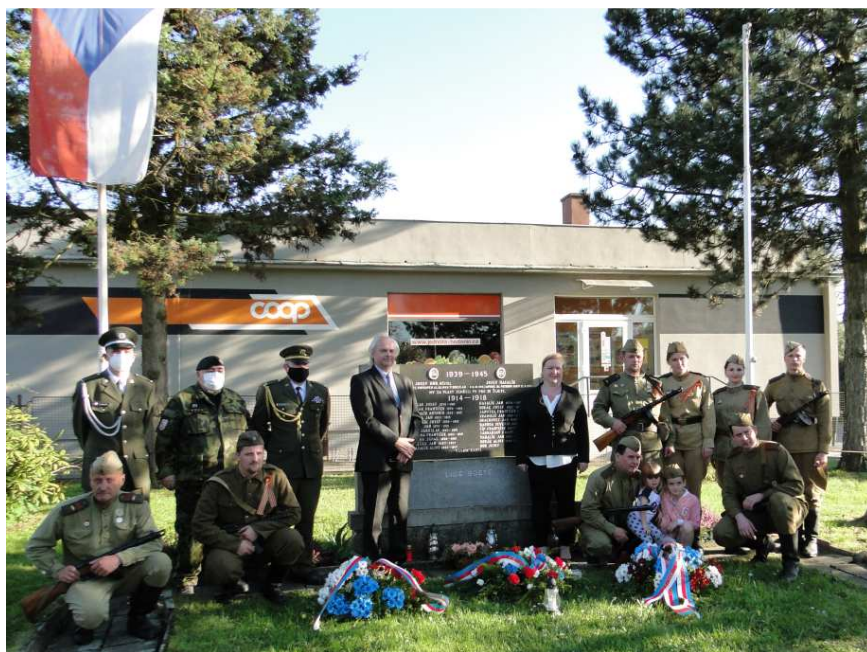
Foto z pietní akce u pomníku

V centru obce v pondělí 10. května 2021, kdy byly krátce připomenuty události konce druhé světové války, následovalo položení kytic květů k uctění památky padlým, za přítomnosti vojáků místního vojenského zařízení a vojenské policie a čestné stráže příslušníků Klubu vojenské historie Tatry Spišské Bystré a VIZE 70 plus. Na závěr byla vypálena i čestná salva.