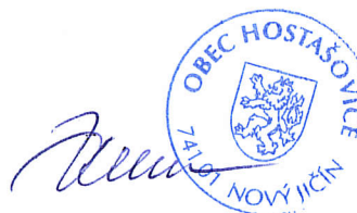
Zdeněk Kelnar starosta

Příloha: Snímek katastrální mapy - pozemky určené k prodeji jsou označeny žlutě